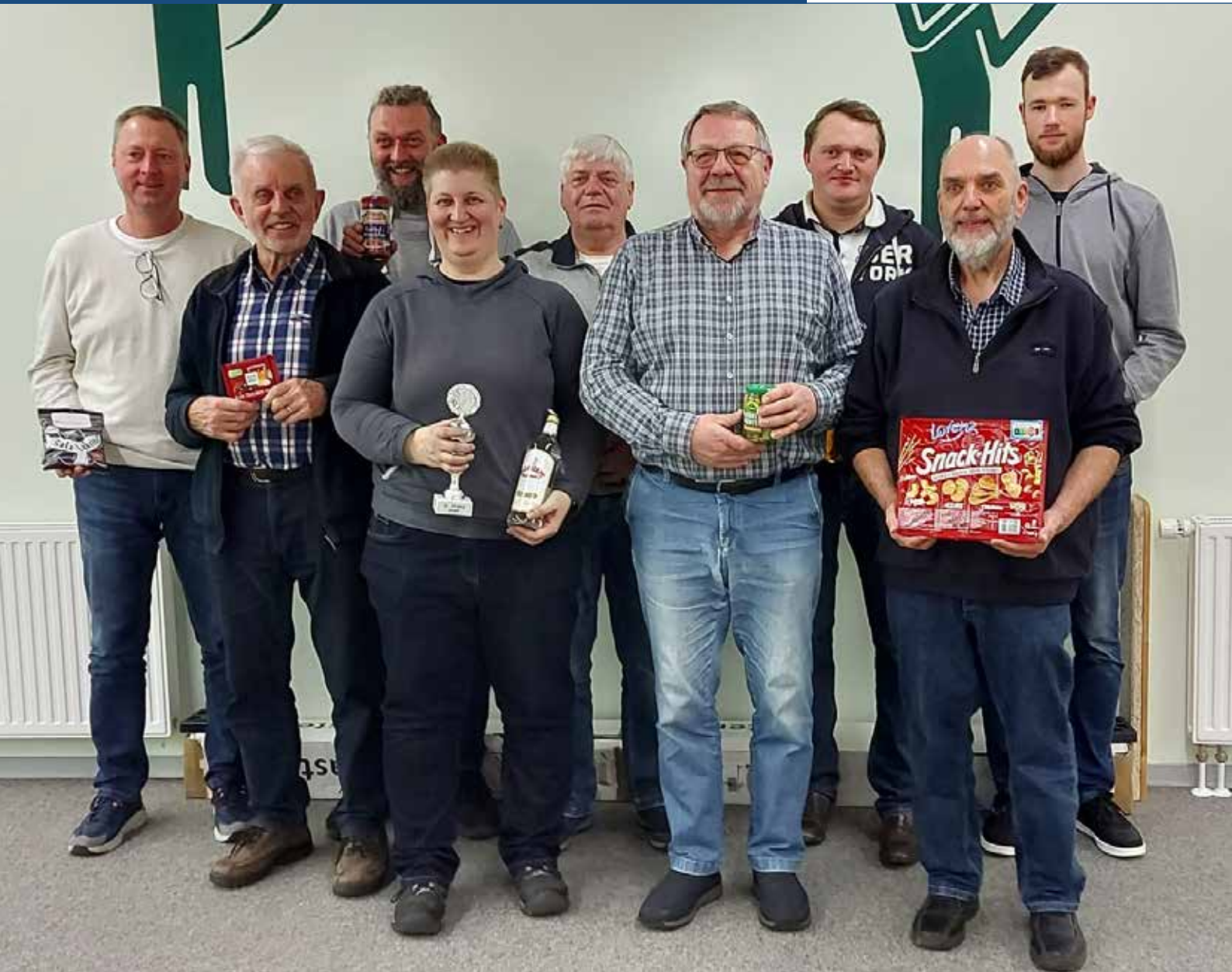
Die Gewinner und die Gewinnerin des diesjährigen Spätschießens der Freiwilligen Feuerwehr Fockbek

Das Rathaus ist am 10.05.2024 geschlossen