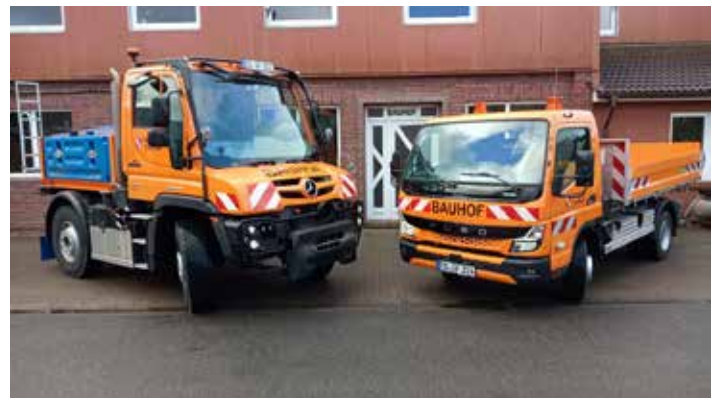
Das Bild zeigt die beiden neuen Fahrzeuge Unimog U 219 (links) und Fuso Canter (rechts)