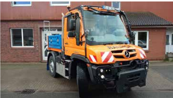
Das Bild zeigt den Unimog U 219 mit der neuen Bewässerungstechnik